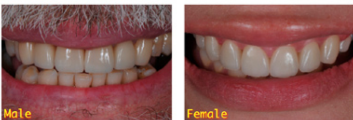
ฟันที่มีลักษณะ เพศชาย

ยังมีการออกแบบให้ฟันต่างๆ มีความอ่อนหวานสำหรับผู้หญิง หรือ แข็งแกร่งสำหรับผู้ชาย ทั้งหมดนี้ จะต้องเจรจากับทันตแพทย์ที่ให้การรักษาก่อน การกรอเตรียมฟัน