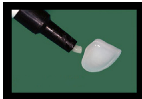
ยึดด้วยกาววิทยาศาสตร์

ไม่แตกต่างกัน แต่คนใช้ส่วนใหญ่จะสามารถมองเห็นมิติสีในฟันได้อย่างดี เข้าใจว่า ฟันต้องมีปลายฟันใส มีรอยไม่เรียบตามธรรมชาติของฟัน และฟันซี่หนึ่งๆ จะมีสีแตกต่างจากคอฟันไปปลายฟัน คนใช้แบบนี้เรียกได้ว่ามีความสามารถ “ซาบซึ้ง” ธรรมชาติของฟันได้เหมือนคนที่สามารถ “ซาบซึ้ง” ศิลปะเป็น อย่างไรก็ตามคุณภาพงานของแพทย์ ก็ทำให้ราคาค่ารักษาด้วยวีเนียร์ต่อซี่ ราคาสูงขึ้น (เฉลี่ย 14,000-18,000 ต่อซี่) ไม่ใช่การจ่ายราคาสูงเพราะคลินิกที่หรู หรือคลินิกในโลเคชั่นที่มีค่าเช่าแพง ก่อนทำการรักษาท่านจึงควรศึกษาวิธีการให้ดี และค้นหาแพทย์เฉพาะทางที่สามารถทำงานทางด้านนี้โดยเฉพาะ (แพทย์เฉพาะทางด้านนี้ได้แก่ ทันตกรรมบูรณะเพื่อความสวยงาม ทันตกรรมประดิษฐ์ หรือทันตกรรมหัตถการ) ก่อนเข้ารับการรักษาก็ขอผลงานของแพทย์ที่รักษาก่อน พูดคุยในรายละเอียด และถามข้อดีข้อเสียในเคสของตนเองก่อนเริ่มทำฟัน จะได้ไม่ผิดหวังหรือเสียใจในภายหลัง