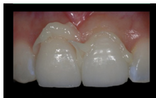
ยึดด้วยกาววิทยาศาสตร์