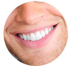
ฟันกระต่าย